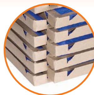
Diseño con marco muescado