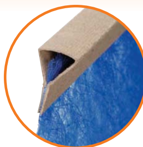
Diseño con marco comprimido